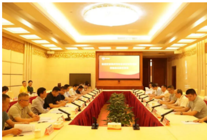
种养加一体化现代农业产业园项目招商推介会现场

该项目建成投产后，预计有机肥处理中心将具备年产5万吨高品质生物有机肥的生产能力。