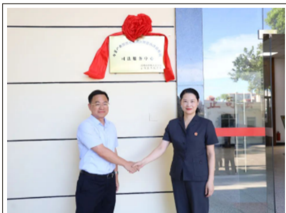
中菲产业深度对接园区暨常山涉侨维权司法服务中心揭牌现场