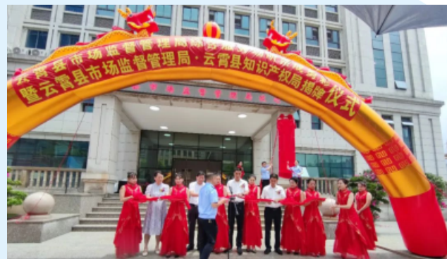
与会领导共同为云霄县市场监督管理局·云霄县知识产权局揭牌

云霄县市场监管局综合服务场所总投资1989.92万元，规划总用地面积4166.47平方米，总建筑面积6080平方米，云霄县市场监督管理局综合服务场所的落成投入使用，将充分展示县市场监管队伍的新形象、激发新活力、争创新业绩，助推市场监管事业再上新台阶，为我县高质量发展再添动力，再创新绩。