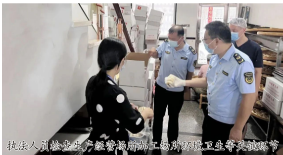
执法人员检查生产经营场所加工场所环境卫生等关键环节

本报讯（曾攻）随着中秋节的临近，月饼作为传统节日食品，其质量安全备受社会关注。9月9日至9月10日，云霄县市场监督管理局作为食品安全的主要监管部门，组织执法人员对月饼市场进行专项监督检查，以排查食品安全风险隐患，强化月饼质量安全监管，确保广大市民能够吃上放心、安全的月饼。