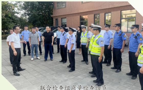
联合检查组商量检查细节

下一步，我县将进一步加大联合检查工作力度，常态化开展校园周边文化环境和市场经营秩序专项治理行动，发挥多部门联合执法效能，共同营造健康安全的校园周边环境。