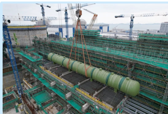
漳州核电3号机组除氧器吊装就位