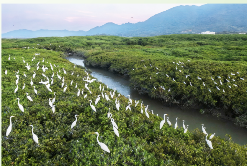
区域重要的“蓝色碳库”漳江口红树林