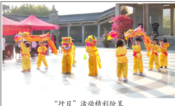
“圩日”活动精彩纷呈

活动以“移风易俗传新风·家庭文明共成长”为主线，通过多元互动、便民服务与亲子实践相结合的形式，设置移风易俗宣传区、便民服务区 and 亲子互动区三大板块。移风易俗宣传区志愿者围绕“十提倡、十抵制”内容，结合展板讲解、互动问答等形式，向群众宣传彩礼减负、喜事新办等文明理念。便民服务