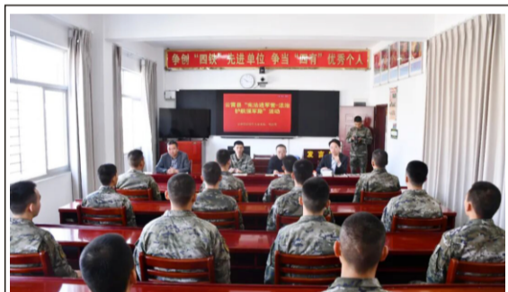
特邀律师为官兵进行普法宣讲