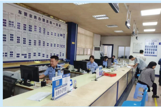
窗口工作人员查询相关数据中

此次便民新政严守驾驶人身体条件准入标准，既保障了源头安全管控，又提升了政务服务效率。下一步，云霄公安将持续拓展数据复用、减证便民等场景，深化“高效办成一件事”改革，以更优流程、更快速度、更暖服务擦亮服务品牌。