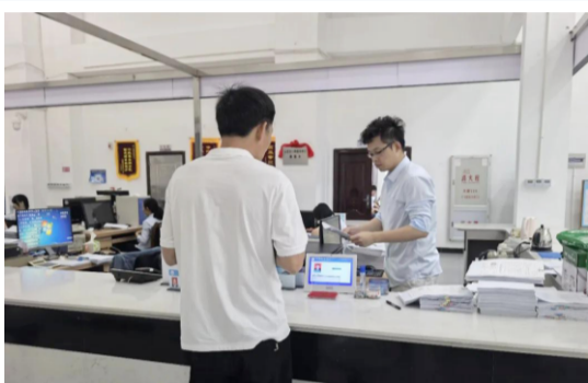
常山首张林木采伐许可证正式核发现场

本报讯（汤一帆 汤潮端）5月12日，在云霄县政务服务中心林业局窗口，随着工作人员完成审批办结，云霄县与常山开发区划整合后的首张林木采伐许可证正式核发，标志着两地林业审批一体化政务服务全面落地见效。