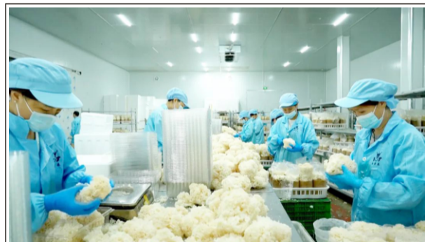
绣球菌工厂化生产现场

港荣泰生物科技改造提升项目的实践，生动诠释了“精准转型、提质增效”的发展成效。云霄县以“争优”姿态，通过靠前服务、精准帮扶，推动企业化市场压力为转型动力，不仅助力企业重塑竞争优势，更为县域特色现代农业转型升级提供了有益借鉴。